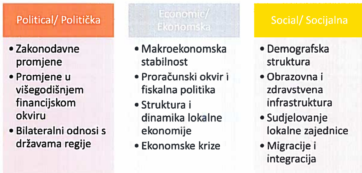
Slika 2: Pestel analiza

PESTEL analiza (eng./hrv. Political/Politička; Economic/Ekonomska; Social/Socijalna; Tehnological/Tehnološka; Enviroment/Okolišna; Legal/Pravna) je analitička i kvalitativna metoda koja se koristi pri makro analizi utjecaja vanjskih faktora na LIRA-u, odnosno utjecaj navedenih šest skupina koje bi mogle značajno utjecati na djelokrug rada i poslovanje te projekte LIRA-e.