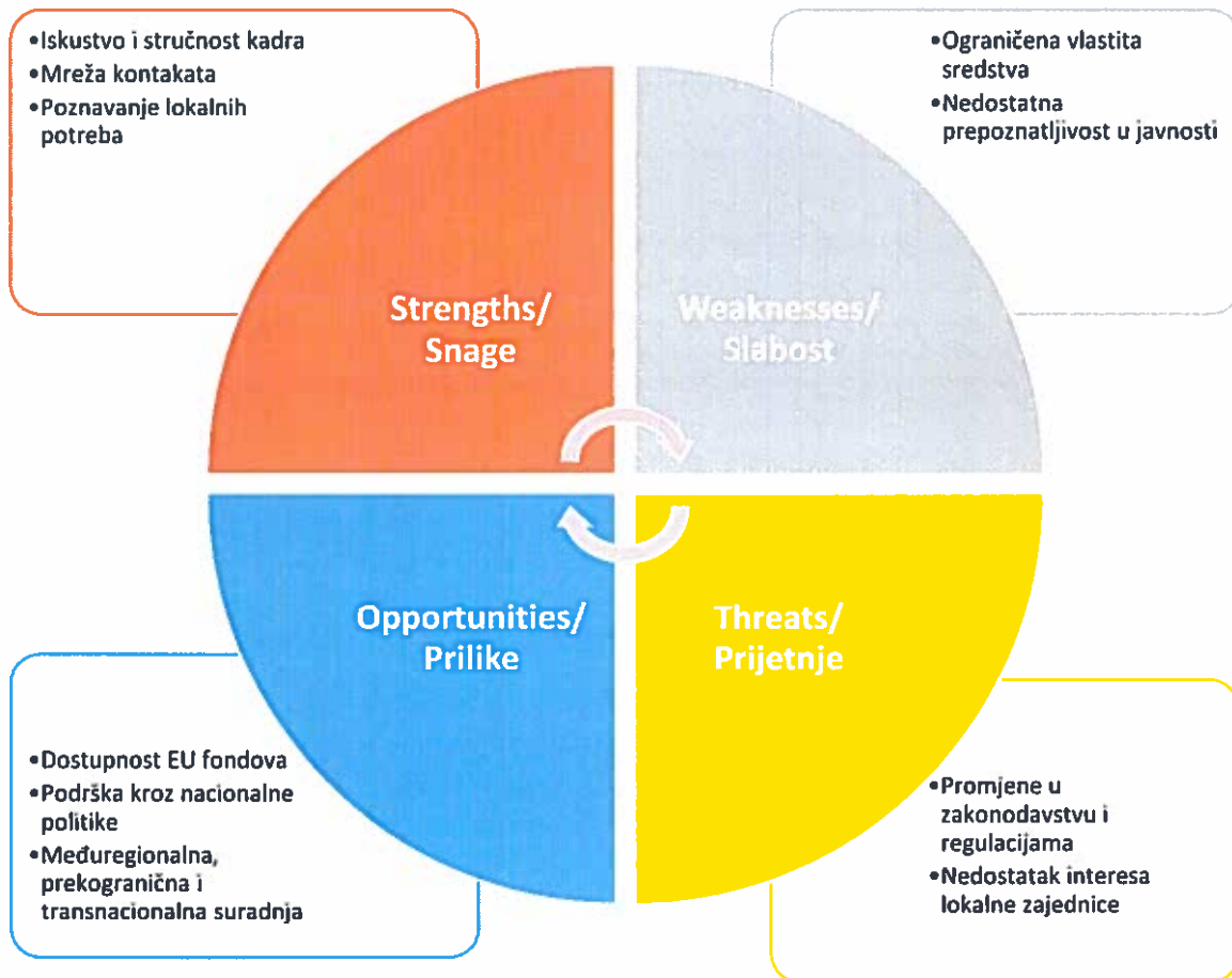
Slika 3: SWOT analiza