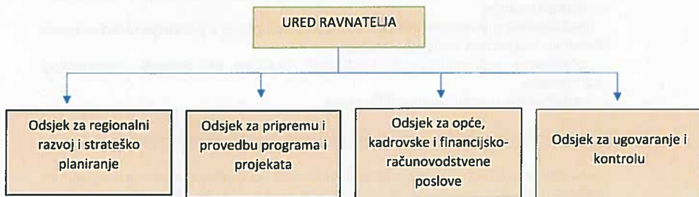
Grafikon 1 – Organizacijska struktura LIRA-e

Na dan 31.12.2023. godini u LIRA-i zaposleno je ukupno 24 djelatnika od čega 12 djelatnika na neodređeno vrijeme i 12 djelatnika na određeno vrijeme. . Od 01.01.2024. godine, sedam djelatnika koji su dosad bili zaposleni na određeno vrijeme primljeni su u radni odnos na neodređeno vrijeme, dok je jedna djelatnica okončala svoj radni odnos u LIRA-i.